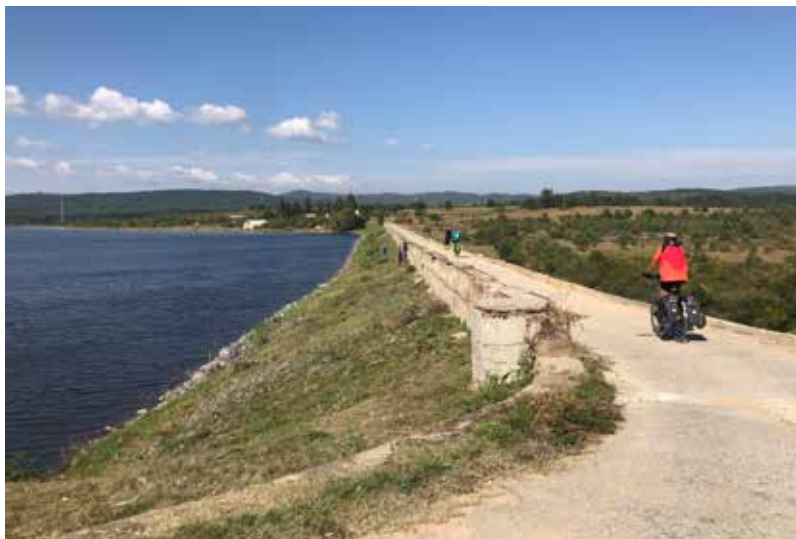
Stuwmeer in Bulgarije.

send actief. We zien T-shirts met teksten als Drielandentour Herfst 2018 en Zomertour 2017. Bij de start is er de obligate groepsfoto met de vlag van de club. Een drone vliegt boven ons mee om de aankomst in elk dorp te filmen. Daags nadien staan we met lichtgevende jasjes en met Eco Club banderols in alle kranten. Wat een feestelijke ervaring om met zijn allen zo te toeren, een gevoel dat extra wordt versterkt door de hoeveelheid lekkernijen. Als vegetariër kan ik mijn hart ophalen in Turkije, wat in Servië en Bulgarije moeilijker was. De kilo's die we eraf gefietst hebben, zijn er zo weer aan.