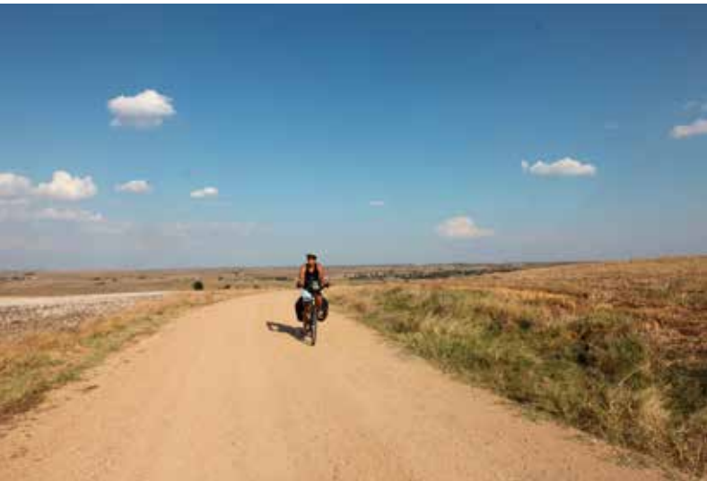
Door het Turkse platteland.