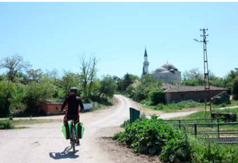
Aankomst in het dorpje Mutlu, wat 'blij' betekent.